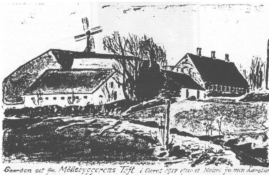
Højagergaard, set fra NØ omkr. 1917

(for at du kan se hvor ussel lønforholdene var dengang skal jeg i Parenthes bemærke at jeg fra 10de october til 1ste April skulde have 3 daler Kurant i løn. 1 daler Kurant