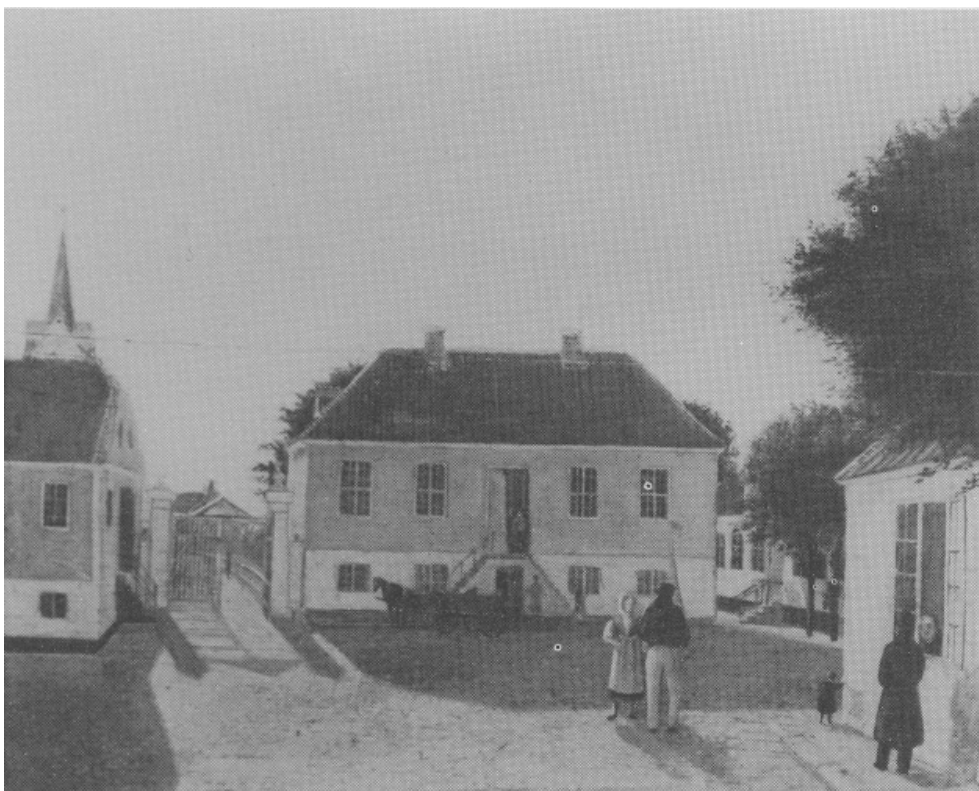
Thisted Rådhus med arrest i kælderen. Opført 1803 - nedrevet 1853

De fandt det ikke mærkeligt, at han ville arbejde på den tid af døgnet, da han ofte forhen havde smedet om natten.