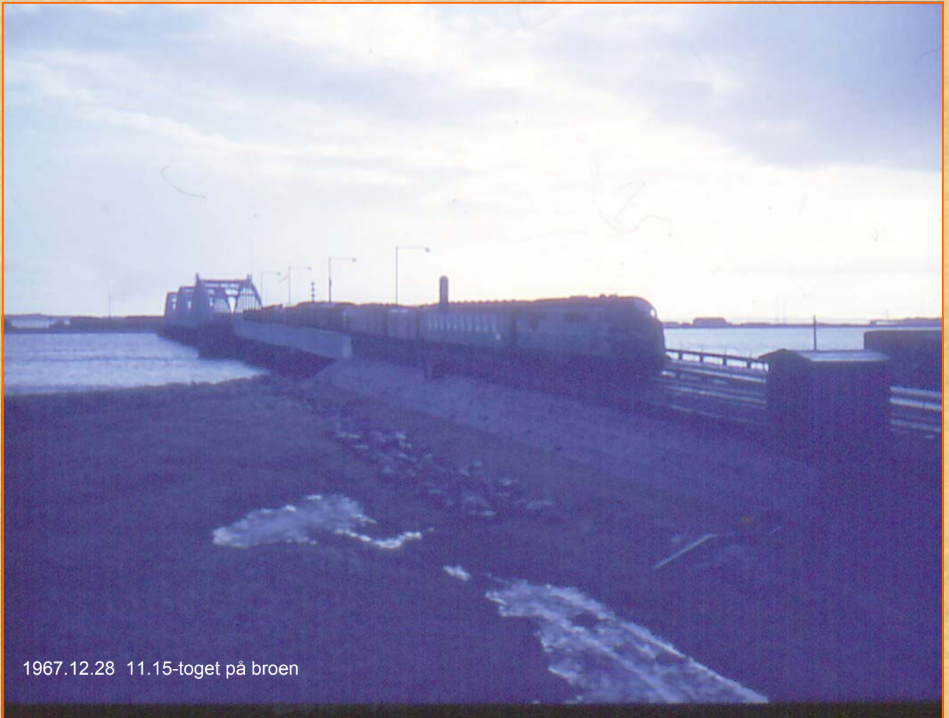
1967.12.28 11.15-toget på broen