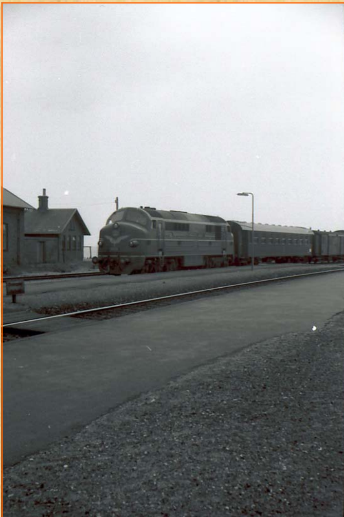
1968.08 ca. Tog på vej i spor 2