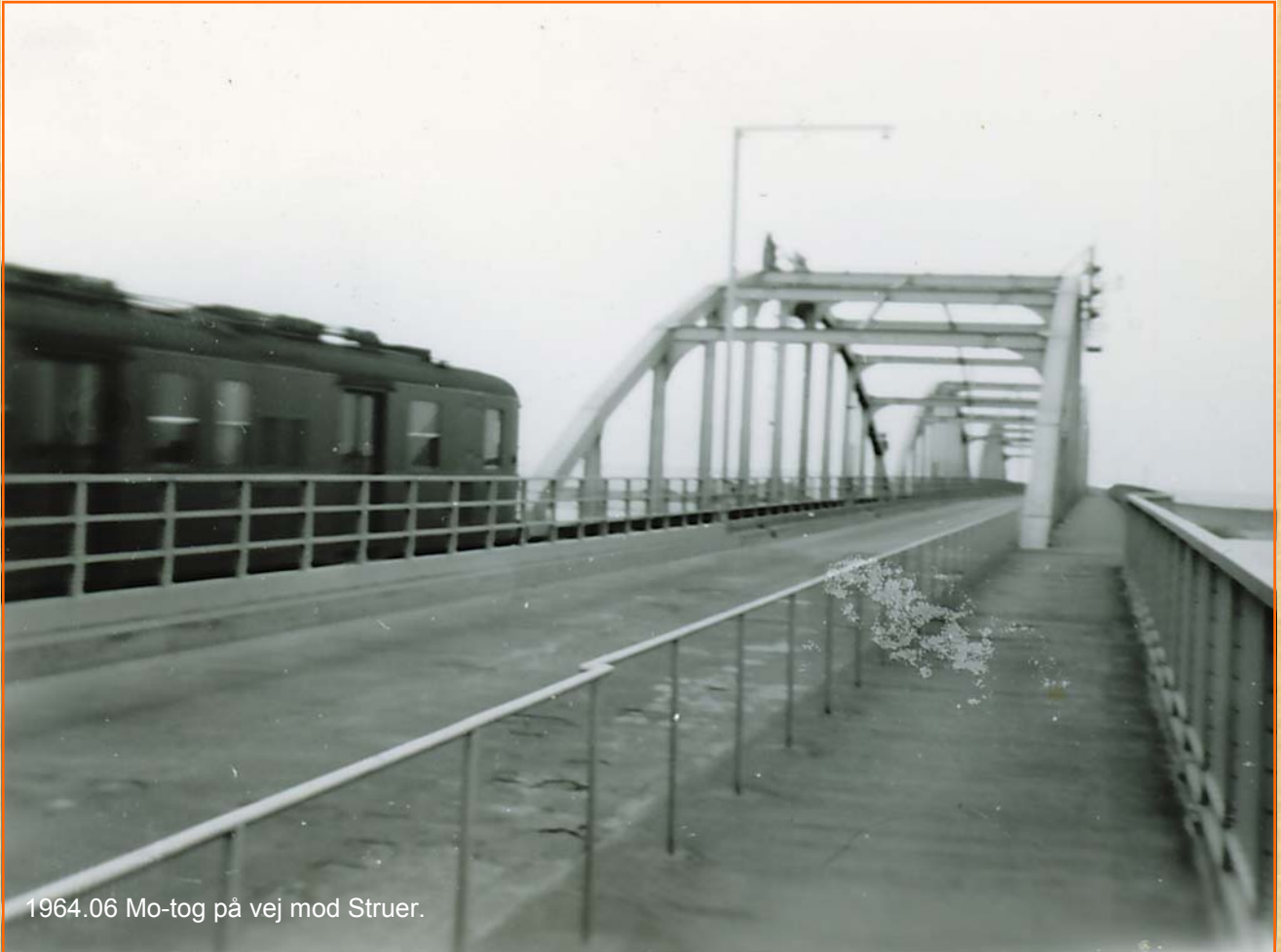
1964.06 Mo-tog på vej mod Struer.